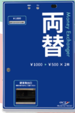
カウンタータイプ (ACT-EC017-S-05)